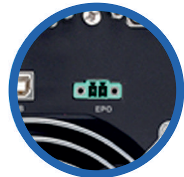
Función opcional de Apagado de Emergencia (EPO)