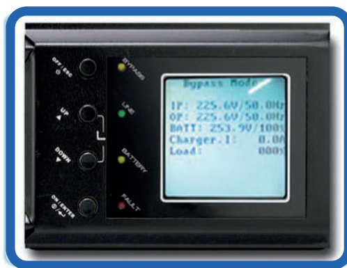
Display LCD Muestra voltajes de entrada, salida, tiempos de autonomía y carga de batería.