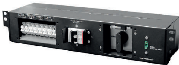
Conmutador de Bypass de mantenimiento