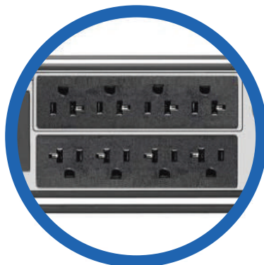
8 terminales NEMA 5-15R, de los cuales 4 son programables