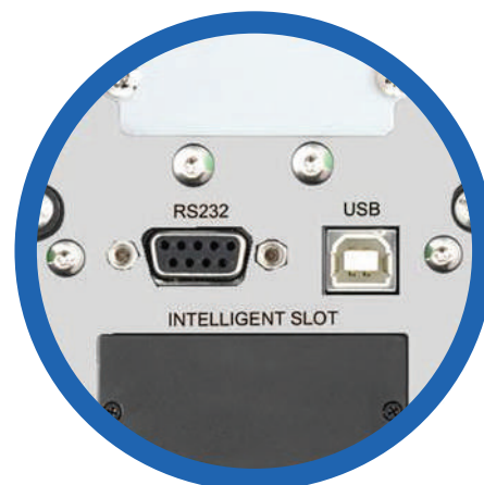
Puertos de comunicación