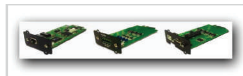
Tarjetas opcionales SNMP y de control