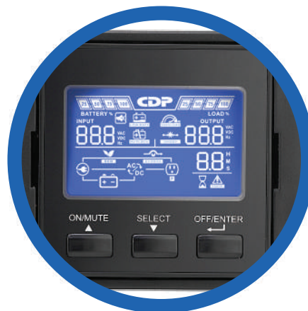
Panel LCD con rotación de 90°