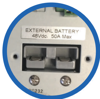
Entrada banco de baterías externas