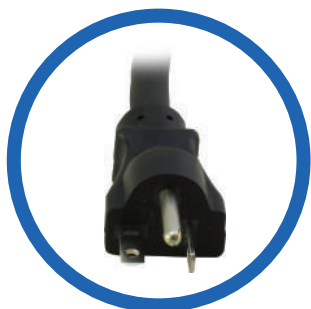
Cable de alimentación CA NEMA 5-20P